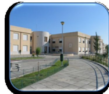
EBI do Bom Sucesso