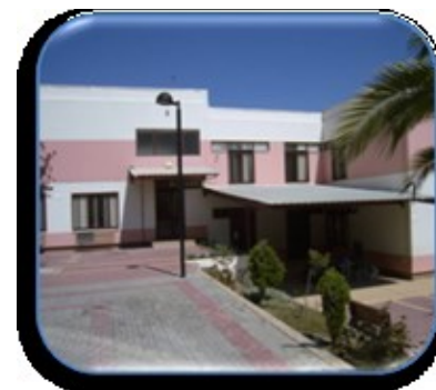
EB1 de Arcena

A construção do presente Plano de Melhorias tem por base: o Relatório de Avaliação do Plano de Melhorias de 16/17 a 18/19 realizado pela equipa do Observatório; Relatórios de Autoavaliação das Estruturas do Agrupamento; o Relatório dos PI Anuais de Atividades; a Carta de Missão do Diretor de Agrupamento 2017-2020; Projeto Educativo do Agrupamento 17-18 a 19-20, o Plano de Ação Estratégica 16-17; o último Relatório de Avaliação Externa do Agrupamento de março de 2013 assim com questionários de satisfação aplicados a uma amostra de 25% da população/comunidade educativa.