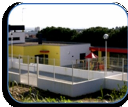
JI do Bom Sucesso