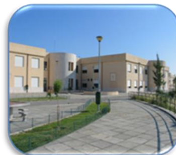
EBI do Bom Sucesso