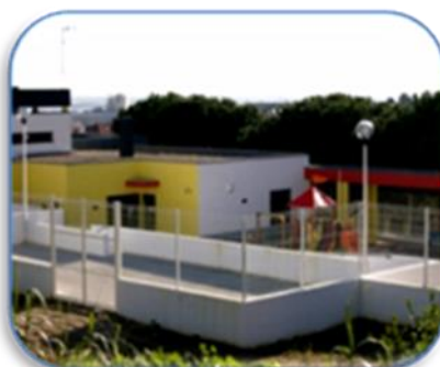
JI do Bom Sucesso