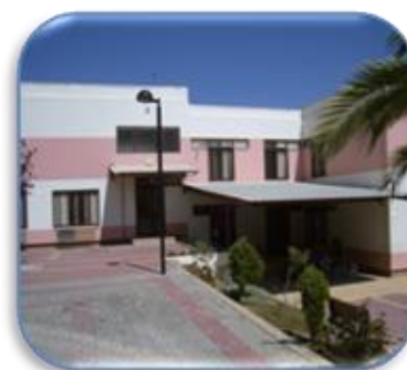
EB1 de Arcena

A construção deste Plano de Melhoria teve como referências o Relatório de Autoavaliação de 13/14 a 15/16 realizado pela presente equipa do Observatório, os Relatórios de Autoavaliação das Estruturas do Agrupamento, o Relatório do Plano Anual de Atividades 2015-2016, a Carta de Missão do Diretor de Agrupamento e o Projeto Educativo do Agrupamento considerando a extensão aprovada para o ano letivo de 16/17 e ainda o Relatório Final do Projeto Educativo 2013-2016.